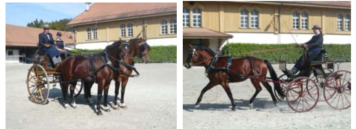
Attelage en Curricle

Qui savait que les premières documentations des traces de bridons sur les dents des chevaux dataient de 3700 à 3000 BC au Kazakhstan. Qu'un guerrier des Hetiter, Kikkouli a écrit 1350 avant J-C la plus vieille documentation connue sur l'entraînement, la garde et les soins aux chevaux qui étaient destinés à l'attelage de guerre.